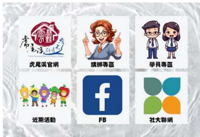
講師專區/社區大學專區六宮格圖示